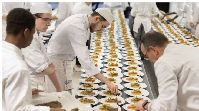
Chefs et apprentis préparent ensemble un repas gastronomique pour 400 convives.

L'UMIH 60, soucieuse de créer des liens entre les futurs professionnels du secteur et les talents du département, a organisé un dîner gastronomique concocté par huit chefs de l'Oise et réalisé avec l'aide d'apprentis issus de l'ensemble des CFA et écoles hôtelières du département. Ce dîner exceptionnel, servi pour 400 convives, s'est tenu le 9 avril au château de Nogent-sur-Oise en présence d'Eric Abihssira, vice-président confédéral.